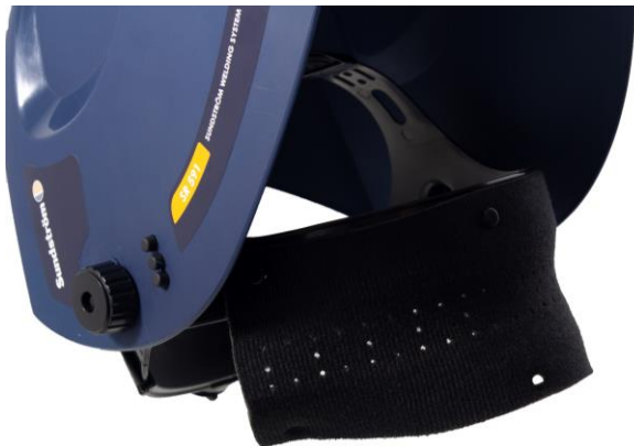
7.2 Montera svettbandet på huvudställningen.