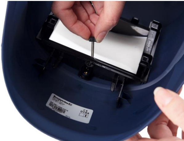
4.1 Lossa skruven i hållaren som håller svetsglas