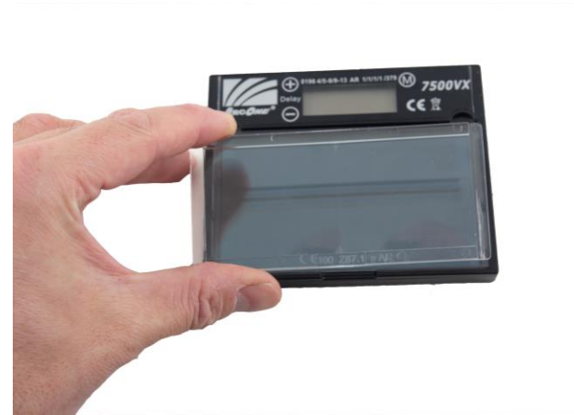
5.3 Montera korrektionsglaset på insidan av svetsglaset.