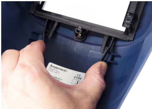
6.2 Lossa hållaren som håller svetsglaset.