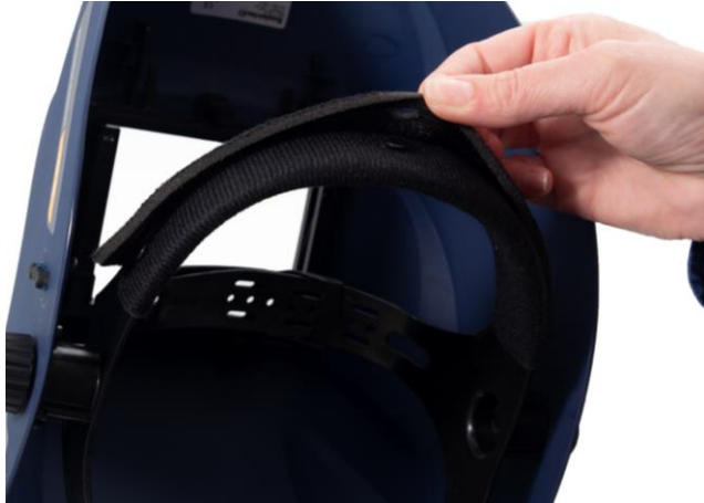
7.1 Ta bort svettbandet