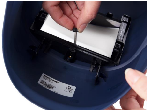
5.1 Lossa skruven i hållaren som håller svetsglaset