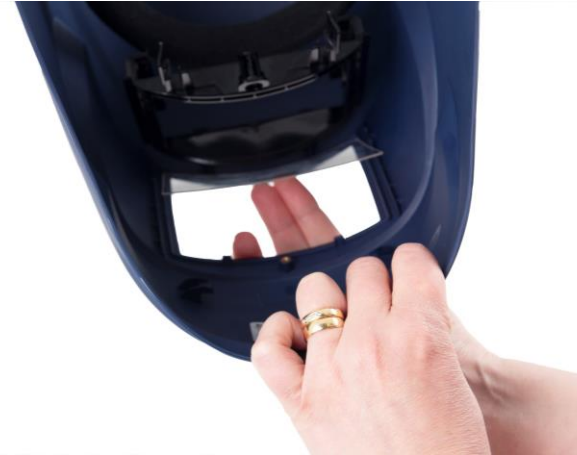
6.3 Lossa och ta bort det yttre skyddsglaset.