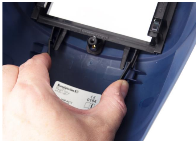
4.2 Lossa hållaren som håller svetsglas