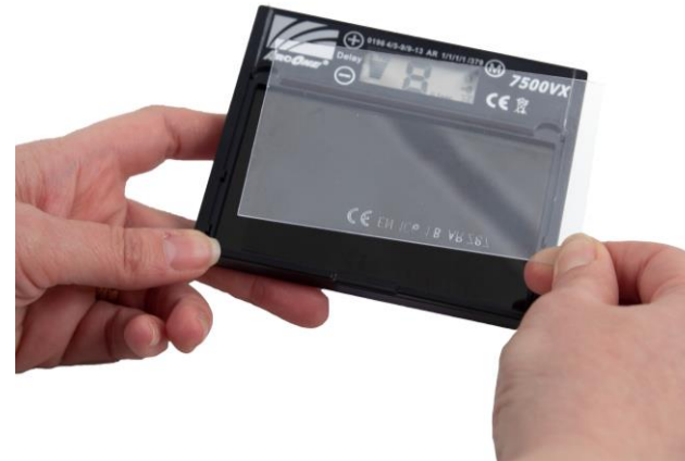
4.3 Montera inre skyddsglas på insidan av svetsglas