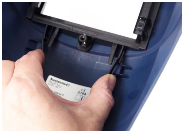
5.2 Lossa hållaren som håller svetsglaset.