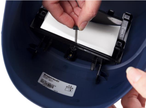
6.1 Lossa skruven i hållaren som håller svetsglaset