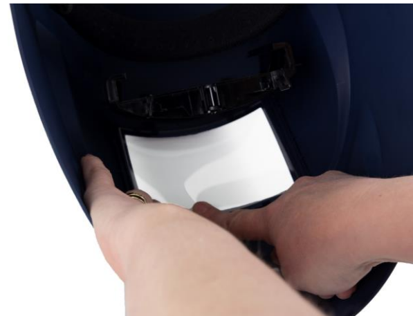
6.4 Montera det nya yttre skyddsglaset. Montera hållaren. Fäst skruven.