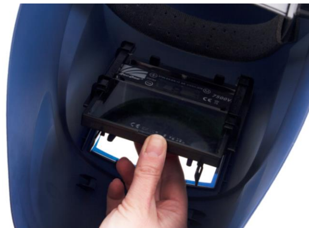
4.4 Skjut in svetsglas i hållaren. Klicka tillbaka hållaren och skruva tillbaka skruven.