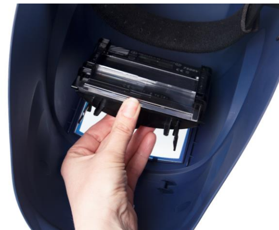
5.4 Skjut in svetsglaset i hållaren. Klicka tillbaka hållaren och skruva tillbaka skruven.